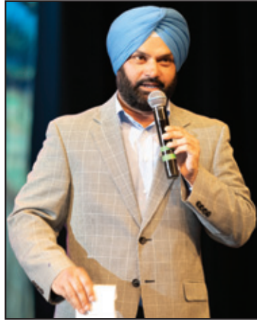
ਦਾ ਸਨਮਾਨ ਕੀਤਾ ਗਿਆ। ਇਕ ਵਿਆਹ 'ਤੇ ਮੇਲੇ ਦੇ ਆਉਣ 'ਤੇ ਗਿੱਧਾ ਪਾਉਣ ਦੀ ਪੇਸ਼ਕਾਰੀ ਨੇ ਦਰਸ਼ਕਾਂ ਨੂੰ ਵਾਹ ਵਾਹ ਕਰਨ ਲਾ ਦਿੱਤਾ। ਸਰੋਤਿਆਂ ਨੇ ਭਰਪੂਰ ਤਾੜੀਆਂ ਵਜਾ ਕੇ ਆਪਣੇ