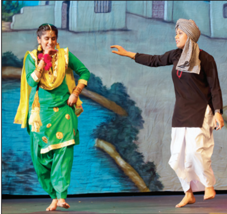
ਮਲਕੀ-ਕੀਮਾ ਪੇਸ਼ ਕੀਤਾ, ਜੋ ਸਰੋਤਿਆਂ ਖਾਸ ਕਰ ਪੰਜਾਹਵਿਆਂ ਨੂੰ ਟੱਪੇ ਸਰੋਤਿਆਂ ਨੇ ਬਹੁਤ