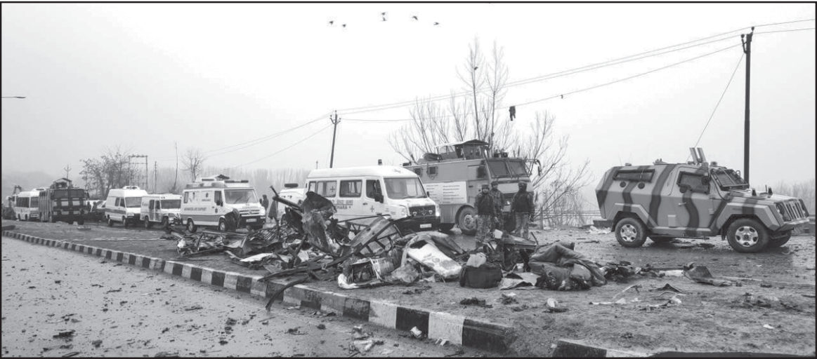
ਪੁਲਵਾਮਾ 'ਚ ਅਤਿਵਾਦੀ ਹਮਲੇ ਦੀ ਮਚਾਈ ਤਬਾਹੀ ਦਾ ਇਕ ਦ੍ਰਿਸ਼