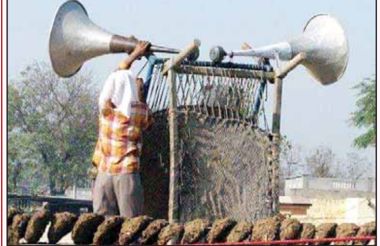
ਮੰਜਿਆਂ ਉਤੇ ਭਾਈ ਨੇ ਦਿੱਤੇ ਹੌਰਨ ਟੰਗ। ਲੰਬੜਾਂ ਦੇ ਘਰ ਜਾਪਦਾ ਹੋਣਾ ਪਾਠ ਅਰੰਭ।