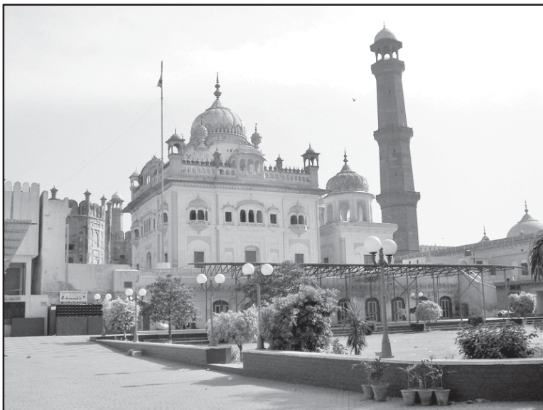
ਲਾਹੌਰ ਵਿਚ ਸਥਿਤ ਗੁਰਦੁਆਰਾ ਡੇਹਰਾ ਸਾਹਿਬ ਜੋ ਪੰਜਵੀਂ ਪਾਤਸ਼ਾਹੀ ਸ੍ਰੀ ਗੁਰੂ ਅਰਜਨ ਦੇਵ ਜੀ ਦੀ ਸ਼ਹੀਦੀ ਨਾਲ ਸਬੰਧਤ ਹੈ

ਕੈ ਗੁਰ ਅਰਜਨ ਦਰਿਆਉ ਨ ਬੋਝਿਉ। ਸਿੱਖ ਰਾਜ ਵੇਲੇ ਰਾਵੀ ਦਰਿਆ ਤਾਂ ਤਕਰੀਬਨ ਇਥੋਂ ਦੇ ਸਦੀਆਂ ਤੋਂ ਵਧ ਸਮਾਂ ਬੀਤ ਜਾਣ ਬਾਅਦ ਵਾਹਵਾ ਦੂਰ ਚਲਾ ਗਿਆ ਸੀ।