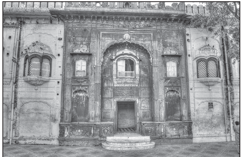
ਲਾਹੌਰ ਵਿਚ ਮਹਾਰਾਜਾ ਰਣਜੀਤ ਸਿੰਘ ਦੀ ਸਮਾਧ ਦਾ ਮੁੱਖ ਦਰਵਾਜ਼ਾ

ਮਹਾਂਬਲੀ ਰਣਜੀਤ ਸਿੰਘ ਹੋਇਆ ਪੈਦਾ, ਨਾਲ ਜ਼ੋਰ ਦੇ ਮੁਲਕ ਹਲਾਇ ਗਿਆ। ਮੁਲਤਾਨ, ਕਸ਼ਮੀਰ, ਪਿਸ਼ੋਰ, ਚੰਬਾ, ਜੰਮੂ, ਕਾਂਗੜਾ, ਕੋਟ ਨਿਵਾਇ ਗਿਆ। ਤਿੱਬਤ ਦੇਸ ਲਦਾਖ ਤੇ ਚੀਨ ਤੱਤੀ, ਸਿੱਕਾ ਆਪਣੇ ਨਾਮ ਚਲਾਇ ਗਿਆ। ਸ਼ਾਹ ਮੁਹੰਮਦਾ ਜਾਣ ਪਚਾਸ ਬਰਸਾਂ, ਅੱਛਾ ਰੱਜ ਕੇ ਰਾਜ ਕਮਾਇ ਗਿਆ। ਮਹਾਰਾਜਾ ਰਣਜੀਤ ਸਿੰਘ 1799 ਵਿਚ 19 ਵਰ੍ਹਿਆਂ ਦੀ ਉਮਰੇ ਲਾਹੌਰ ਦੇ ਤਖ਼ਤ 'ਤੇ ਬੈਠਾ ਸੀ। 1839 ਵਿਚ ਉਹ ਕਾਲ ਵੱਸ ਹੋਇਆ। ਅੰਗਰੇਜ਼ਾਂ ਨੇ ਆਪਣੀ ਕੂਟਲ ਨੀਤੀ ਨਾਲ ਪੰਜਾਬ 'ਤੇ 1849 ਵਿਚ ਮੁਕੰਮਲ ਏਕਾਧਿਕਾਰ ਕਰ ਲਿਆ। ਪੰਜਾਬ ਵਿਚ ਇਹ ਦਸ ਵਰ੍ਹੇ ਖਾਨਾਜੰਗੀ ਦੇ ਸਨ, 'ਜਿਹੜਾ ਬਹੋ ਗੱਦੀ ਉਹਨੂੰ ਮਾਰ ਦੋਂਦੇ, ਚੱਲੀ ਵਿਚ ਦਰਬਾਰ ਤਲਵਾਰ ਮੀਆਂ।' ਪੰਜਾਬੀਆਂ ਦੇ ਇਸ ਸਾਂਝੇ ਰਾਜ ਨੇ ਅੱਧੀ ਸਦੀ ਵਿਚ ਖਿੱਤੇ ਦੇ ਲੋਕਾਂ ਦੇ ਆਤਮ ਸਨਮਾਨ ਨੂੰ ਸਿਖਰਾਂ 'ਤੇ ਪਹੁੰਚਾ ਦਿੱਤਾ ਸੀ। ਜੱਟ ਭਾਈਚਾਰੇ ਨੇ ਪਹਿਲੀ ਵਾਰ ਸੱਤਾ ਦਾ ਜਲੋਲ ਵੇਖਿਆ ਸੀ ਅਤੇ ਇਸ ਤਰ੍ਹਾਂ ਉਨ੍ਹਾਂ ਦਾ ਜਾਤੀ ਅਭਿਮਾਨ ਚੋਖਾ ਵਧ ਗਿਆ ਸੀ। ਇਸ