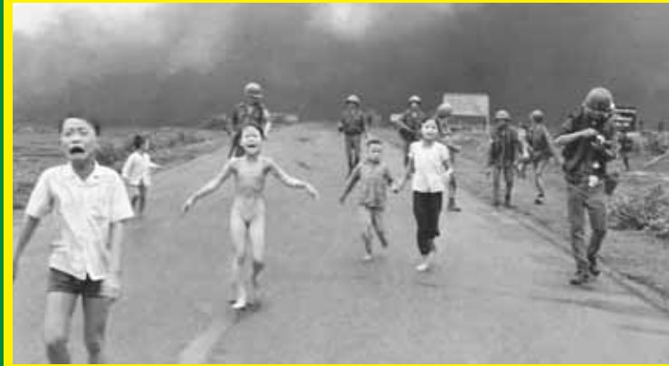
ਤਸਵੀਰਸਾਜ਼ ਕੈਵਨ ਕਾਰਟਰ ਦੀ ਉਹ ਤਸਵੀਰ (ਖੱਬੇ) ਜਿਸ ਨੇ ਉਸ ਦੀ ਜਾਨ ਲੈ ਲਈ ਅਤੇ (ਸੱਜੇ) ਨਾਪਾਮ ਬੰਬ ਚੱਲਣ ਤੋਂ ਬਾਅਦ ਭੱਜੇ ਜਾ ਰਹੇ ਲੋਕ।

ਤਸਵੀਰਸਾਜ਼ਾਂ ਅਤੇ ਦਸਤਾਵੇਜ਼ੀ ਫਿਲਮਸਾਜ਼ਾਂ ਬਾਰੇ ਇੱਕ ਵਿਚਾਰ ਹੈ ਕਿ ਉਹ ਪੀੜਤ ਨੂੰ ਬਚਾਉਣ ਨਾਲੋਂ ਉਹਦੀ ਤਸਵੀਰ ਬਣਾਉਣ 'ਚ ਵਧੇਰੇ ਦਿਲਚਸਪੀ ਰੱਖਦੇ ਹਨ। ਇਹ ਸਵਾਲ ਬਾਰੇ ਆਲਮੀ ਪੱਧਰ 'ਤੇ ਬਹਿਸ ਚੱਲ ਰਹੀ ਹੈ। ਇਹ ਬਹਿਸ ਅਫਰੀਕੀ ਤਸਵੀਰਸਾਜ਼ ਕੈਵਨ ਕਾਰਟਰ ਦੇ ਹਵਾਲੇ ਨਾਲ ਵਧੇਰੇ ਭਖੀ ਸੀ। ਵੀਹਵੀਂ ਸਦੀ ਦੇ ਆਖਰੀ ਦਹਾਕੇ 'ਚ ਸੂਡਾਨ ਭਿਆਨਕ ਅਕਾਲ ਦੀ ਮਾਰ ਹੇਠ ਸੀ। ਕੈਵਨ ਕਾਰਟਰ ਵਲੋਂ ਮਾਰਚ 1993 ਨੂੰ ਖਿੱਚੀ ਤਸਵੀਰ ਨੇ ਕੁੱਲ ਆਲਮ ਨੂੰ ਹਿਲਾ ਕੇ ਰੱਖ ਦਿੱਤਾ। ਤਸਵੀਰ 'ਚ ਭੁੱਖਮਰੀ ਦੀ ਸ਼ਿਕਾਰ ਸੂਡਾਨੀ ਬੱਚੀ ਕਿਲੋਮੀਟਰ ਦੂਰ ਸੰਯੁਕਤ ਰਾਸ਼ਟਰ ਦੇ ਖੁਰਾਕ ਡੇਰੇ ਵੱਲ ਸਰਕ ਰਹੀ ਹੈ। ਪਿੱਛੇ ਬੈਠੀ ਗਿਰਝ ਉਹਦੇ ਮਰਨ ਦੀ ਉਡੀਕ 'ਚ ਹੈ। ਕੈਵਨ ਤਸਵੀਰ ਖਿੱਚ ਕੇ ਉੱਥੋਂ ਚਲਾ ਗਿਆ। ਇਹ ਤਸਵੀਰ 'ਨਿਊ ਯਾਰਕ ਟਾਈਮਜ਼' ਵਿਚ 26 ਮਾਰਚ 1993 ਨੂੰ ਛਪੀ। ਹਜ਼ਾਰਾਂ ਲੋਕਾਂ ਨੇ ਬੱਚੀ ਦੀ ਹੋਣੀ ਬਾਬਤ ਅਖ਼ਬਾਰ ਤੋਂ ਪੁੱਛਿਆ। ਅਖ਼ਬਾਰ ਮੁਤਾਬਕ ਬੱਚੀ ਦੇ ਖੁਰਾਕ ਡੇਰੇ ਤੱਕ ਸਹੀ-ਸਲਾਮਤ ਪਹੁੰਚਣ ਦੀ ਕੋਈ ਜਾਣਕਾਰੀ ਨਹੀਂ ਹੈ। 1994 ਵਿਚ ਇਸ ਤਸਵੀਰ ਨੂੰ ਵੱਕਾਰੀ ਪੁਲਿਟਰਜ਼ ਇਨਾਮ ਮਿਲਿਆ ਪਰ ਬੱਚੀ ਦੀ ਮਦਦ ਨਾ ਕਰਨ ਲਈ ਕੈਵਨ ਦੀ ਦੁਨੀਆਂ ਭਰ 'ਚ ਬਦਨਾਮੀ ਹੋਈ। ਫਲੋਰਿਡਾ ਦੇ ਇੱਕ ਅਖ਼ਬਾਰ ਨੇ ਕੈਵਨ ਬਾਰੇ ਲਿਖਿਆ ਸੀ, "ਬੱਚੀ ਦੇ ਦਰਦ ਦਾ ਸਹੀ ਖਾਕਾ ਖਿੱਚਣ ਲਈ ਕੈਮਰੇ ਦਾ ਸ਼ੀਸ਼ਾ ਸੰਵਾਰ ਰਿਹਾ ਲੁਟੇਰਾ ਬੰਦਾ, ਦ੍ਰਿਸ਼ ਵਿਚ ਬੈਠੀ ਦੂਜੀ ਗਿਰਝ