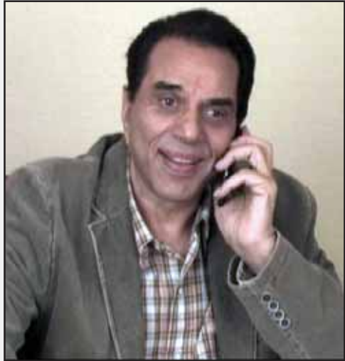
ਪੰਜਾਬ ਟਾਈਮਜ਼ ਦਾ ਨਾਂ ਲਓ ਅਤੇ 50 ਮਿੰਟ ਮੁਫਤ ਲਓ

ਬਾਰੂ ਲਿਟਰ ਦੀ ਬੋਤਲ ਵਾਲੀ ਇਸ ਸ਼ਰਾਬ ਦੀਆਂ ਸਿਰਫ਼ ਛੇ ਬੋਤਲਾਂ ਹੀ ਬਣਾਈਆਂ ਗਈਆਂ ਸਨ। ਅਰਬੀਆ ਬਿਜ਼ਨਸ ਦੀ ਰਿਪੋਰਟ ਮੁਤਾਬਕ ਇਸ ਦੀਆਂ ਤਿੰਨ ਬੋਤਲਾਂ ਲਈ ਖਰੀਦਦਾਰਾਂ ਨੂੰ ਦੁਬਈ ਦੀ ਇਕ ਦੁਕਾਨ 'ਚ ਆਉਣਾ ਪਵੇਗਾ। 400 ਸਾਲ ਪੁਰਾਣੀ ਬਲਟਜ਼ਰਜ ਦਾ ਉਤਪਾਦਨ ਚੇਤਾਓ ਮੈਰਗਾਕਸ ਵਾਈਨਯਾਰਡ, ਫਰਾਂਸ 'ਚ ਹੋਇਆ ਸੀ ਤੇ ਹੁਣ ਇਸ ਨੂੰ ਦੁਬਈ ਅੰਤਰਰਾਸ਼ਟਰੀ ਹਵਾਈ ਅੱਡੇ ਦੇ ਲੇ ਕਲਾਸ ਵਾਈਨ ਸਟੋਰ 'ਤੇ ਰੱਖਿਆ ਗਿਆ ਹੈ।