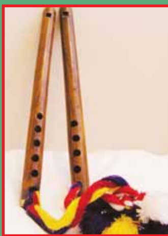
ਲੁਧਿਆਣੇ ਲਵੇ ਦੇ ਲਗੋਜਿਆਂ ਦੇ ਸ਼ੌਕੀ ਬਾਹਲੇ...