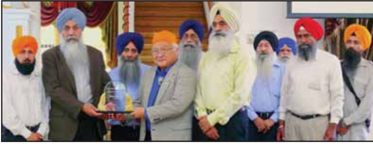
ਮਾਈਕ ਹਾਂਡਾ ਦਾ ਸਨਮਾਨ ਕਰਦੇ ਹੋਏ ਗੁਰਦੁਆਰਾ ਪ੍ਰਬੰਧਕ

ਫਰੀਮਾਂਟ (ਬਿਊਰੋ): ਅਮਰੀਕੀ ਕਾਂਗਰਸ ਦੇ 17ਵੇਂ ਜਿਲੇ ਤੋਂ ਡੈਮੋਕਰੇਟਿਕ ਪਾਰਟੀ ਦੇ ਕਾਂਗਰਸਮੈਨ ਮਾਈਕ ਹਾਂਡਾ ਲੰਬੇ ਐਤਵਾਰ ਗੁਰਦੁਆਰਾ ਫਰੀਮਾਂਟ ਪਹੁੰਚੇ ਜਿਥੇ ਪ੍ਰਬੰਧਕ ਕਮੇਟੀ ਅਤੇ ਸੰਗਤਾਂ ਨੇ ਉਨ੍ਹਾਂ ਦਾ ਗਰਮਜੋਸ਼ੀ ਨਾਲ ਸਵਾਗਤ ਕੀਤਾ। ਜ਼ਿਕਰਯੋਗ ਹੈ ਕਿ 17ਵੇਂ ਜਿਲੇ ਵਿਚ ਫਰੀਮਾਂਟ, ਨਿਵਾਰਕ, ਮਿਲਪੀਟਸ, ਸੈਂਟਾ ਕਲਾਰਾ, ਸੰਨੀਵੇਲ, ਕੂਪਰਟੀਨੋ ਤੋਂ ਸੈਨ ਹੋਜ਼ੇ ਆਉਂਦੇ ਹਨ। ਸ੍ਰੀ ਹਾਂਡਾ ਨੇ ਸੰਗਤਾਂ ਦੀ ਲਾਈਨ ਵਿਚ ਲੱਗ ਕੇ ਗੁਰੂ ਗ੍ਰੰਥ ਸਾਹਿਬ ਅੱਗੇ ਮੱਥਾ ਟੇਕਿਆ ਅਤੇ ਉਨ੍ਹਾਂ ਸੰਗਤਾਂ ਨਾਲ ਪੰਗਤ ਵਿਚ ਬੈਠ ਕੇ ਲੰਗਰ ਵੀ ਛਕਿਆ।