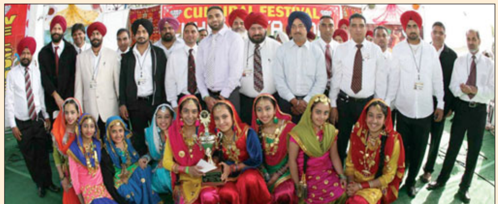
ਦੂਜੇ ਥਾਂ ਤੇ ਆਈ ਗਿੱਧਾ ਟੀਮ ਨਾਲ ਪ੍ਰਬੰਧਕ ਅਤੇ ਪ੍ਰਮੋਟਰ