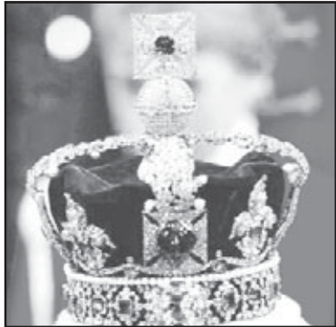
‘ਕੋਹਿਨੂਰ ਹੀਰਾ ਹਰਿਮੰਦਰ ਸਾਹਿਬ ਨੂੰ ਅਰਪਿਤ ਕਰਾਂਗੇ’