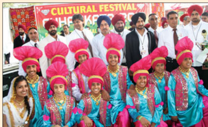
ਜੇਤੂ ਭੰਗੜਾ ਟੀਮ "ਭੰਗੜਾ ਅੰਪਾਇਰ" ਨਾਲ ਪ੍ਰਮੋਟਰ ਅਤੇ ਪ੍ਰਬੰਧਕ