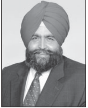
Attorney At Law

*ਰਿਫਿਊਜੀ ਸਟੇਅ *ਵਿਆਹ ਦੇ ਕੇਸ *ਸਿਟੀਜ਼ਨਸ਼ਿਪ *ਡਿਪੋਰਟੇਸ਼ਨ *ਬਿਜਨੈਸ ਵੀਜ਼ਾ *ਇੰਪਲਾਇਮੈਂਟ ਸਬੰਧੀ ਸਪਾਂਸਰਸ਼ਿਪ *ਐਡਾਪਸ਼ਨ ਆਦਿ ਦੇ ਕੇਸਾਂ ਲਈ ਸੰਪਰਕ ਕਰੋ ਲੋਨ ਮੋਡੀਫਿਕੇਸ਼ਨ ਲਈ ਵੀ ਕਾਲ ਕਰੋ