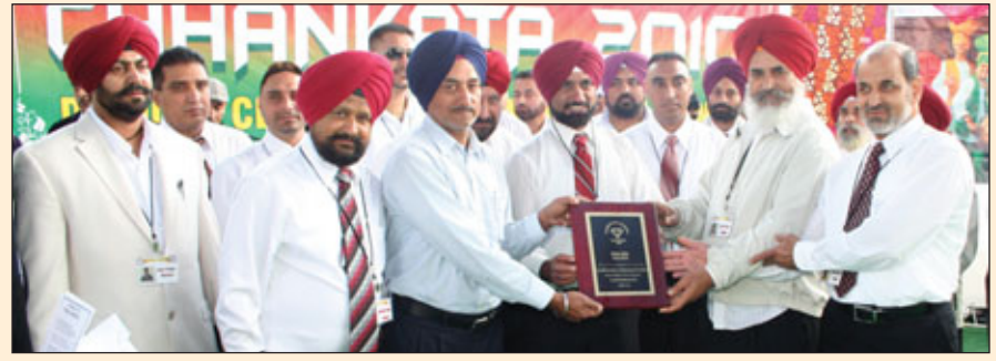
ਸ਼ੇਰ ਆਟੋ ਦੇ ਪ੍ਰਬੰਧਕਾਂ ਦਾ ਸਨਮਾਨ ਕਰਦੇ ਹੋਏ ਪ੍ਰਬੰਧਕ