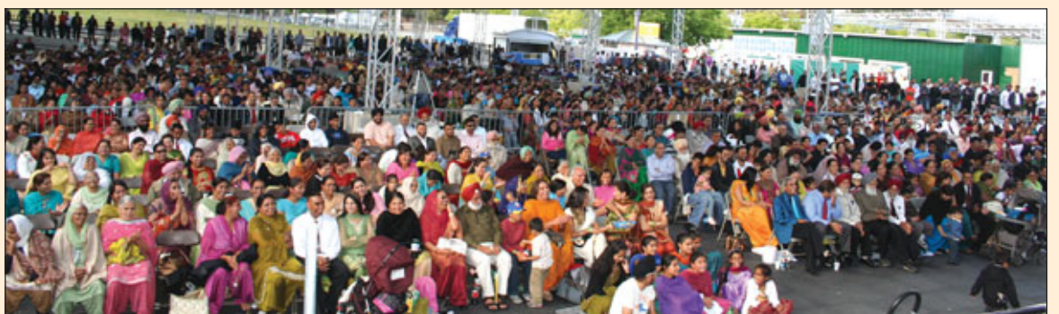
ਹਜ਼ਾਰਾਂ ਦੀ ਤਾਦਾਦ ਵਿਚ ਇਕੱਠੇ ਹੋਏ ਦਰਸ਼ਕ ਸਮਾਗਮ ਦਾ ਆਨੰਦ ਮਾਣਦੇ ਹੋਏ

ਵੇਰਵਾ ਹੁਸਨ ਲੜਿਆ ਬੰਗਾ