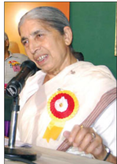
ਲਕਸ਼ਮੀ ਕਾਂਤਾ ਚਾਵਲਾ

ਦੌਰੇ ‘ਤੇ ਆਏ ਪ੍ਰਧਾਨ ਮੰਤਰੀ ਡਾ. ਮਨਮੋਹਨ ਸਿੰਘ ਨੇ ਕਿਹਾ ਹੈ ਕਿ ਸੁਰੱਖਿਆ ਦਸਤਿਆਂ ਨੂੰ ਅਤਿਵਾਦ ਨਾਲ ਨਿਪਟਣ ਦੇ ਨਾਂ ਹੇਠ ਮਨੁੱਖੀ ਅਧਿਕਾਰਾਂ ਦੇ ਘਾਣ ਦੀ ਇਜਾਜ਼ਤ ਨਹੀਂ ਦਿੱਤੀ ਜਾਵੇਗੀ। ਭਾਵੇਂ ਗੁਆਂਢੀ ਦੇਸ਼ ਵਲੋਂ ਪੈਦਾ ਕੀਤੇ ਗਏ ਹਾਲਤ ਬਹੁਤ ਮਾੜੇ ਹਨ ਪਰ ਫਿਰ ਵੀ ਲੋਕਾਂ ਦੇ ਹਿੱਤਾਂ ਨਾਲ ਖੇਡਣ ਦੀ ਇਜਾਜ਼ਤ ਨਹੀਂ ਦਿੱਤੀ ਜਾ ਸਕਦੀ।