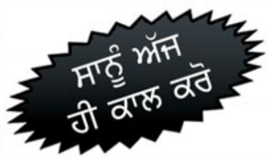
ਟਰੱਕਿੰਗ ਸੇਵਾਵਾਂ ਵਾਸਤੇ