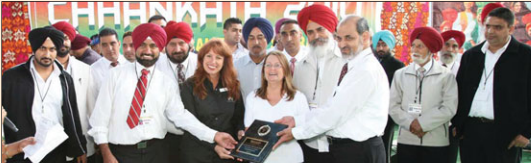
ਵੈਲਜ਼ ਫਾਰਗੋ ਬੈਂਕ ਦੇ ਪ੍ਰਬੰਧਕਾਂ ਦਾ ਸਨਮਾਨ ਕਰਦੇ ਹੋਏ ਪ੍ਰਬੰਧਕ