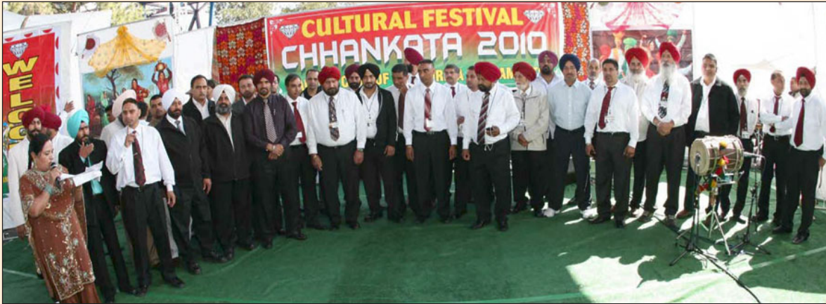
ਡਾਇਮੰਡ ਕਲੱਬ ਕੈਲੀਫੋਰਨੀਆ ਦੇ ਸਮੂਹ ਮੈਂਬਰ ਸਾਹਿਬਾਨ