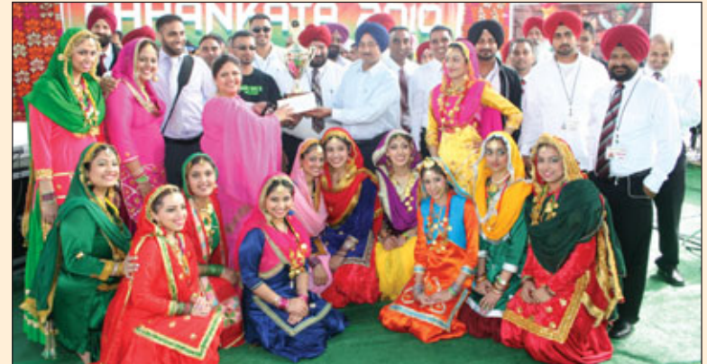
ਪਹਿਲਾ ਇਨਾਮ ਜਿੱਤਣ ਵਾਲੀ ਕੈਨੇਡਾ ਦੀ ਗਿੱਧਾ ਟੀਮ "ਰੌਣਕ ਵਿਹੜੇ ਦੀ" ਨਾਲ ਪ੍ਰਮੋਟਰ ਅਤੇ ਪ੍ਰਬੰਧਕ