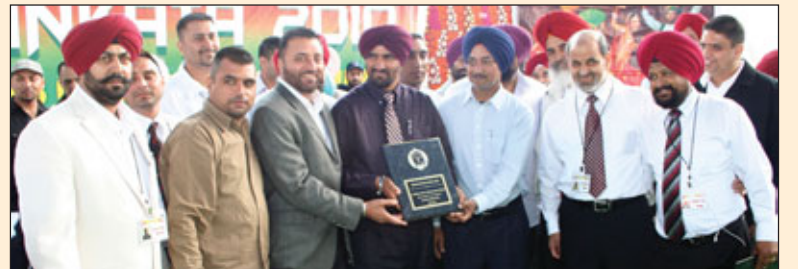
ਡਾਇਮੰਡ ਕਲੱਬ ਕੈਲੀਫੋਰਨੀਆ ਦੇ ਫਰਿਜ਼ਨੋ ਚੈਪਟਰ ਦੇ ਮੈਂਬਰ ਸਾਹਿਬਾਨ