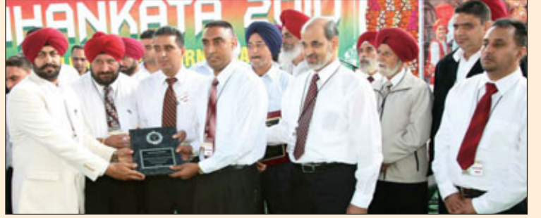
ਚੁਆਇਸ ਮਾਰਕਿਟ ਨੂੰ ਟਰਾਫੀ ਦਿੰਦੇ ਹੋਏ ਪ੍ਰਬੰਧਕ