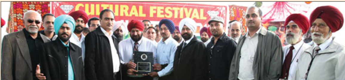
ਡਾਇਮੰਡ ਕਲੱਬ ਕੈਲੀਫੋਰਨੀਆ ਦੇ ਬੇ-ਏਰੀਆ ਚੈਪਟਰ ਦੇ ਮੈਂਬਰ ਸਾਹਿਬਾਨ