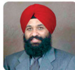
ਟਰੱਕ ਇੰਸ਼ੂਰੈਂਸ ਵਾਸਤੇ