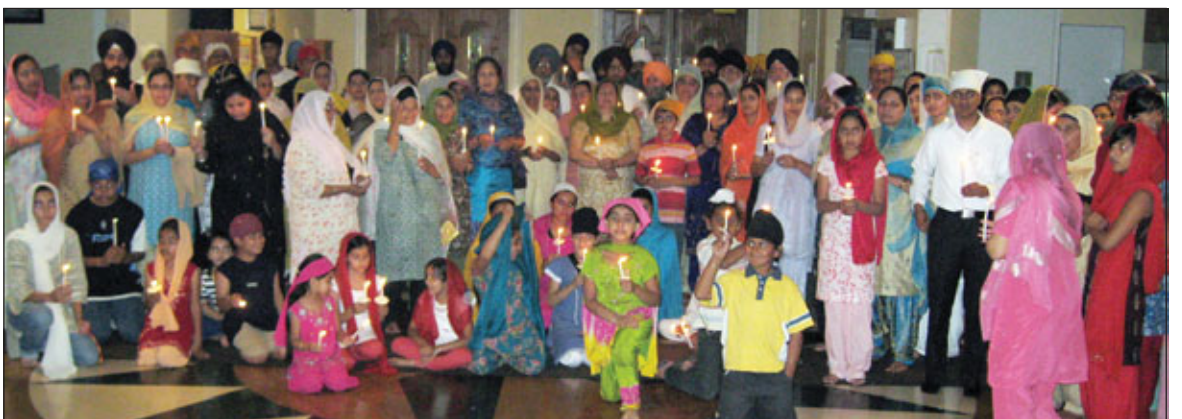
ਨਾਭੇ ਵਾਲੀਆਂ ਬੀਬੀਆਂ ਦਾ ਜਥਾ